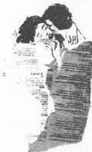
grafika z programu "Romeo i Julia"