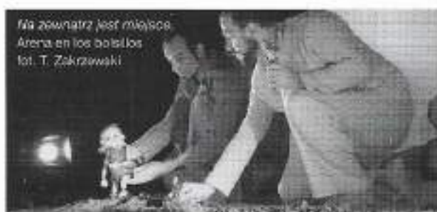
Ma zewnątrz jest miejsce. Arena en los bolsillos