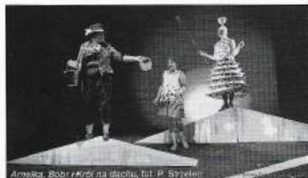
Amelka, Bóbr i Król na dachu

Amelka, Bóbr i Król na dachu – Tankred Dorst, współpraca Ursula Ehler, przekład Jacek Stanisław Buraś, Reż. Jacek Malinowski, scen. Giedrė Brazytė, muz. Antanas Jasenka, projekcje multimedialne Rimas Sakalauskas, Premiera 28 września