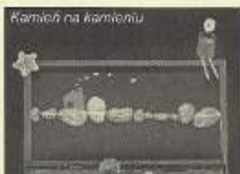
Kamień na kamieniu