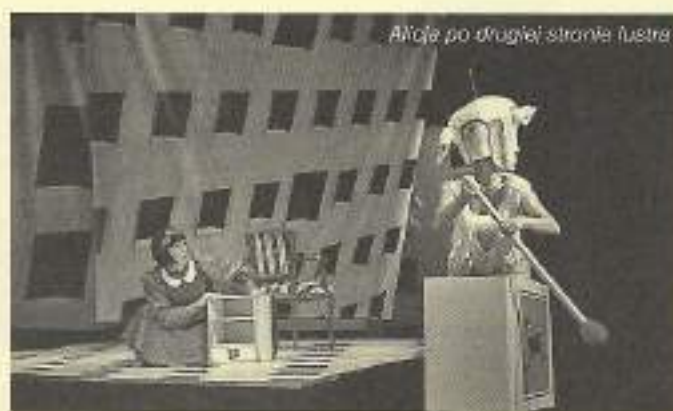
Alicja po drugiej stronie lustra