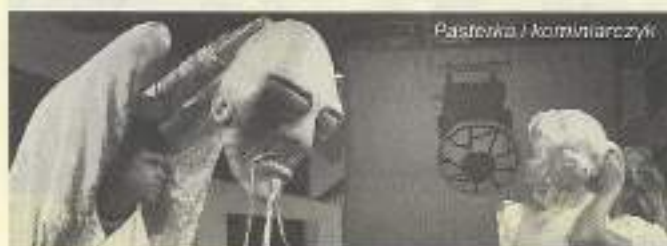
Pasterka i kominiarczyk