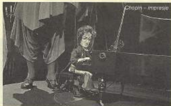
Chopin – impresja