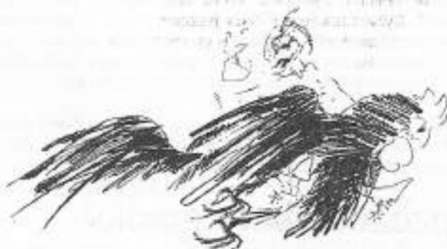
"Pan Twardowski", Teatr (by) Pomorski w Toruniu