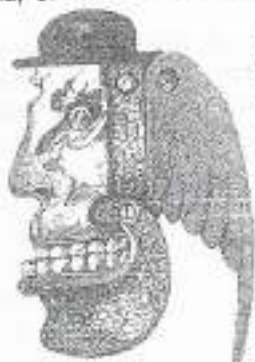
J. Mydlarska-Kował "Działek do oczyszczania"

"Koty" - Waldemar Wolański. Reż. Waldemar Wolański, scen. Bogdan Dowiasz. Premiera 11 października.