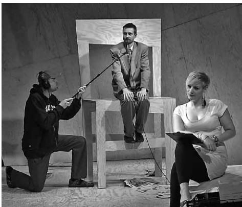
Kartoteka