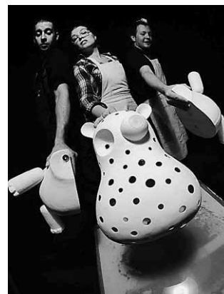
Le Filo Fable

Le Filo Fable – na motywach bajek filozoficznych z różnych stron świata. Scenariusz i reż. Joanna Gerigk, scen. Jan Polívka, konsultacje muzyczne Jarosław Szczepny. Premiera 29 września