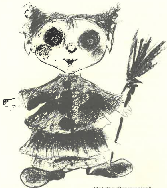
„Malutka Czarownica”, Teatr Lalki i Aktora Kubuś, Kielce

Wrocławski Teatr Lalek, Wrocław: Córka Króla Mórz – Żywia Karasińska-Fluks Reż. i choreogr. Beata Pejcz, scen. Jadwiga Mydlarska-Kowal, muz. Marcin Mirowski