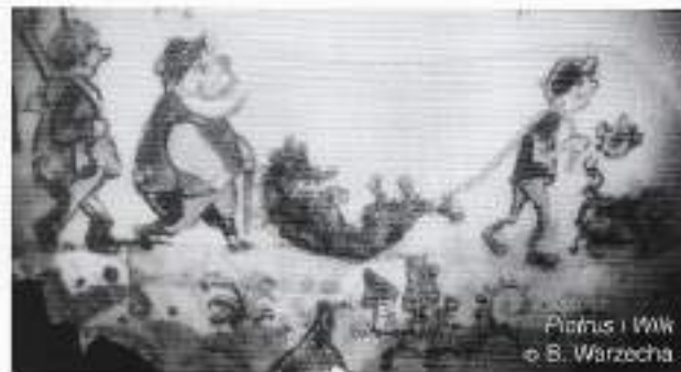
Piotruś i Wilk © B. Warzecha