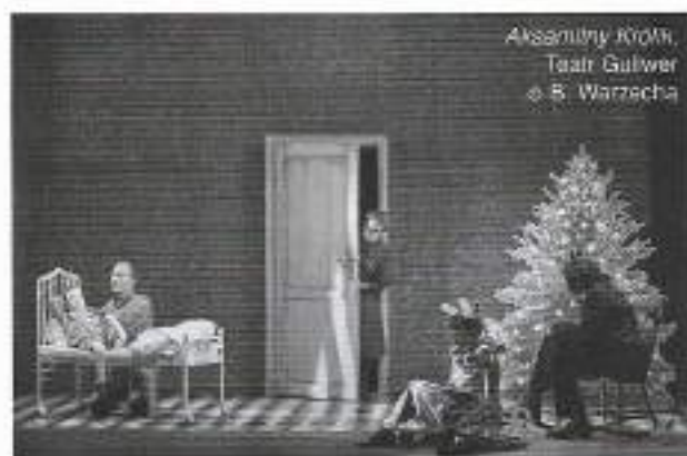
Aksamitny Królik Teatr Guliwer