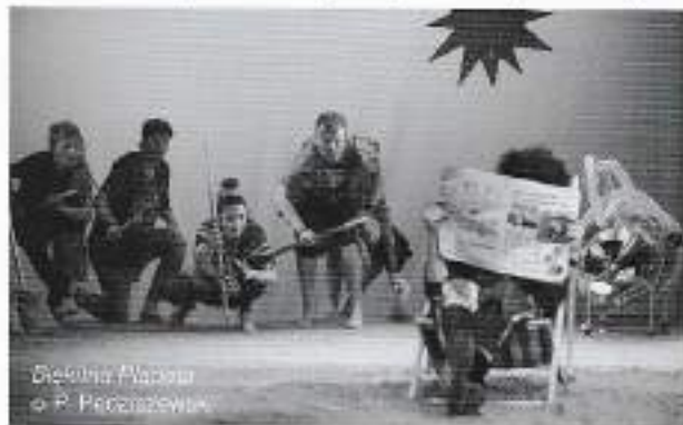
Błękitna Planeta