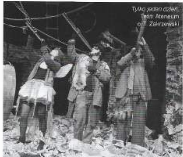
Tylko jeden dzień. Teatr Ateneum o.l. Zakrzewski