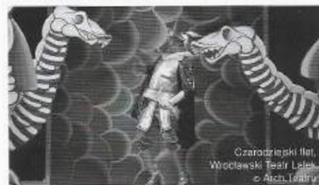
Czarodziejski flet, Wrocławski Teatr Lalek

Plastusiówy pamiętnik – Maria Kownacka Adaptacja i reż. Lech Chojnacki, scen. Dariusz Panas, muz. Jarosław Kordaczuk. Premiera 6 grudnia 2014