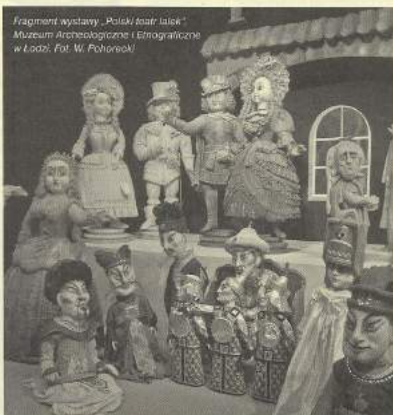
Fragment wystawy „Polski teatr lalek” Muzeum Archeologiczne i Etnograficzne w Łodzi.