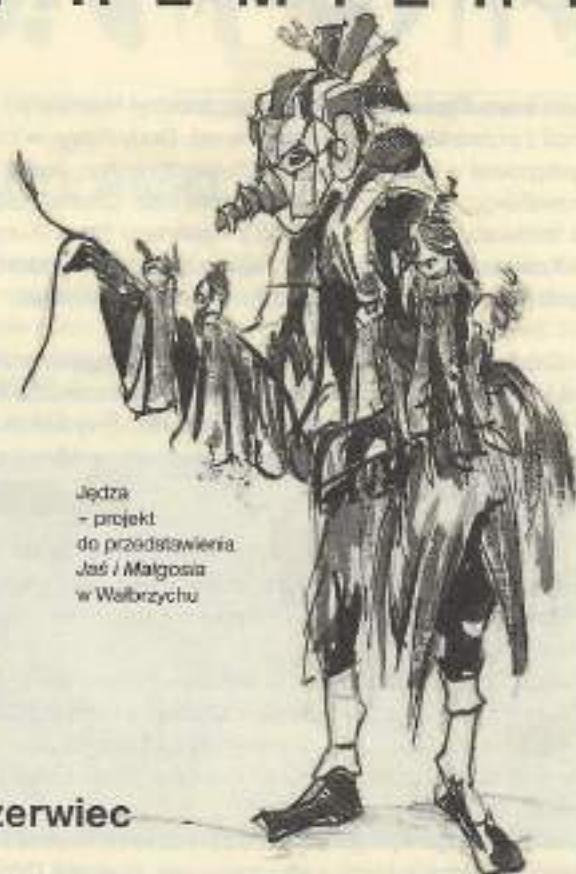
Jędra - projekt do przedstawienia Jaś i Małgosia w Wałbrzychu