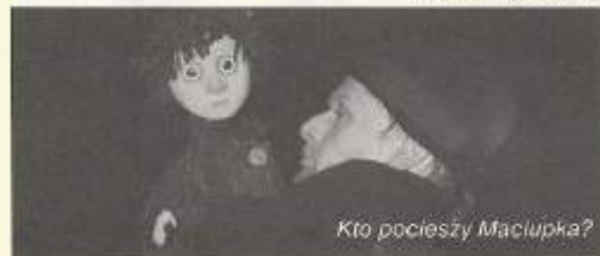
Kto pocieszy Maciupka?