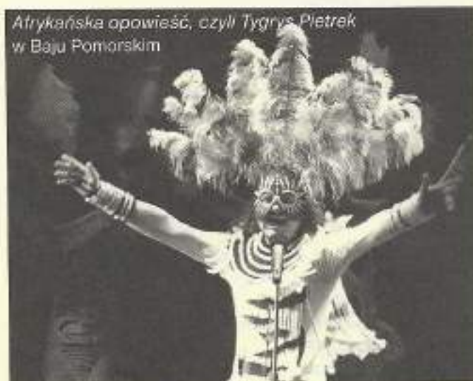
Atrykańska opowieść, czyli Tygrys Pietrek w Bajce Pomorskim