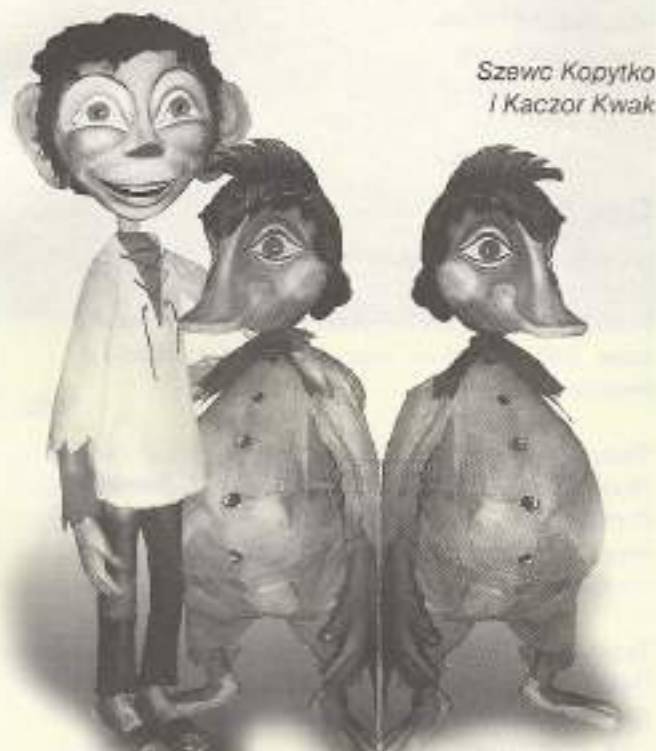
Szewc Kopytka i Kaczor Kwak