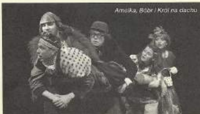
Amelka, Bóbr i Król na dachu