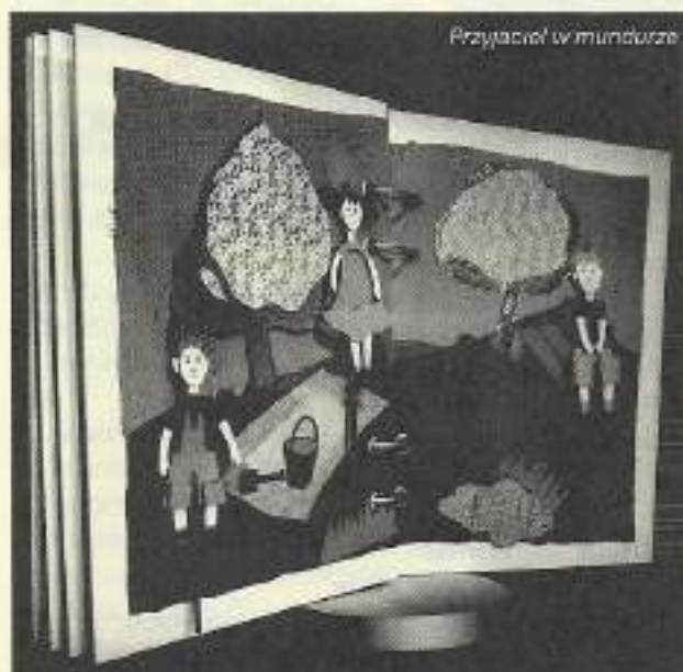
Przyjaciel w mundurze