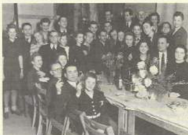
Zespół Poznańskiego Teatru Marionetek, 1946 r.

Sama premiera była świętem dla zespołu, który in corpore pracował nie tylko przy spektaklu, ale również musiał przygotować widownię na przyjęcie publiczności.