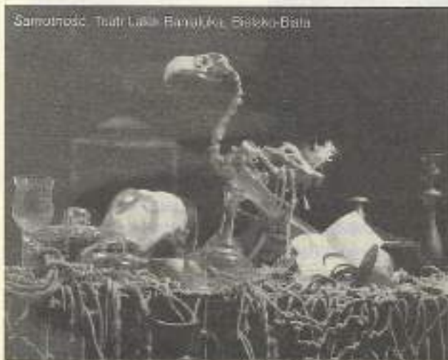
Samotność, Teatr Lalek Bańska Bystrzyca, Białko-Biała