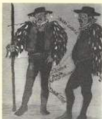
Sen nocy letniej, Wrocławski Teatr Lalek