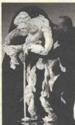
Piękna i Bestia