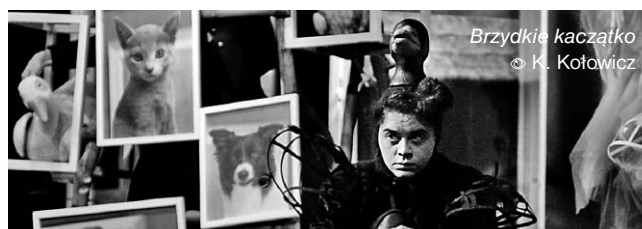
Brzydkie kaczątko © K. Kołowicz