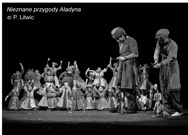
Nieznane przygody Aladyna