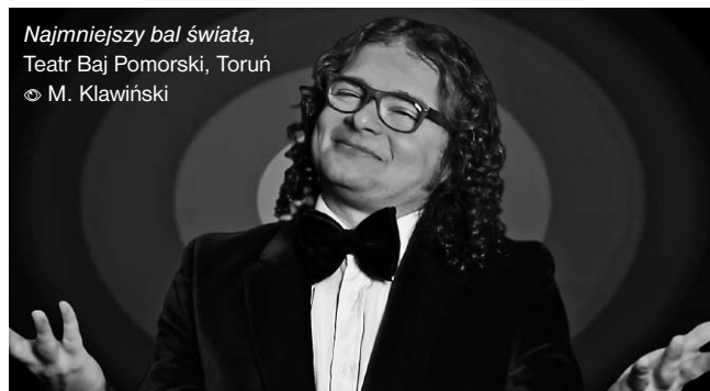
Najmniejszy bal świata , Teatr Baj Pomorski, Toruń