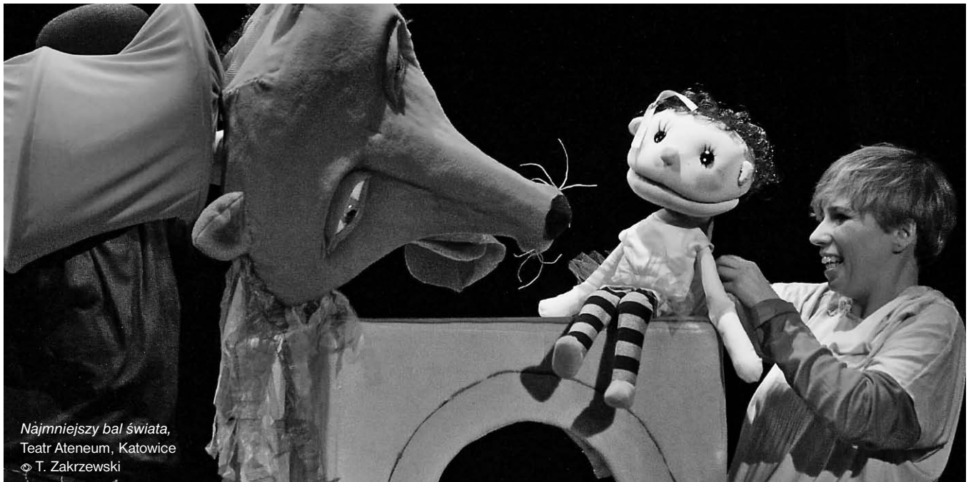
Najmniejszy bal świata, Teatr Ateneum, Katowice