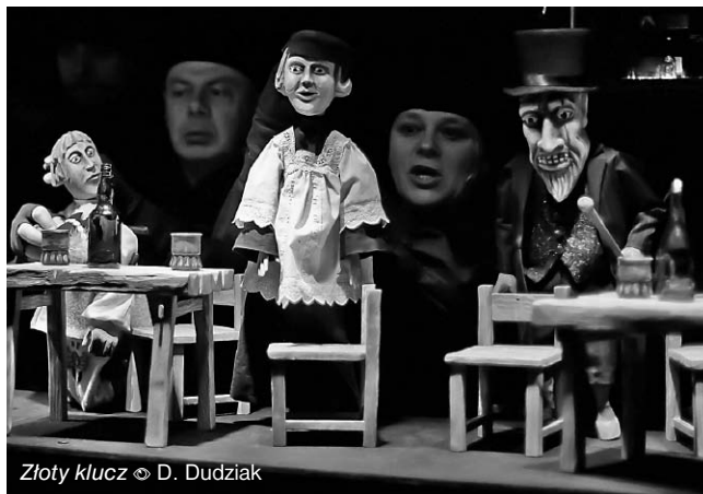
Złoty klucz