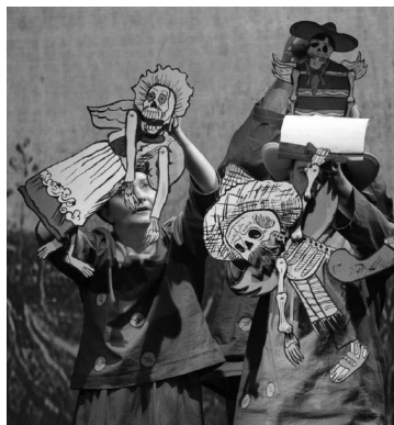
Pocztówki z Meksyku

Pocztówki z Meksyku – Berta Hiriart. Reż. Ewa Piotrowska, scen. Edyta Rzewuska, muz. Wojciech Błażejczyk. Premiera 13 marca